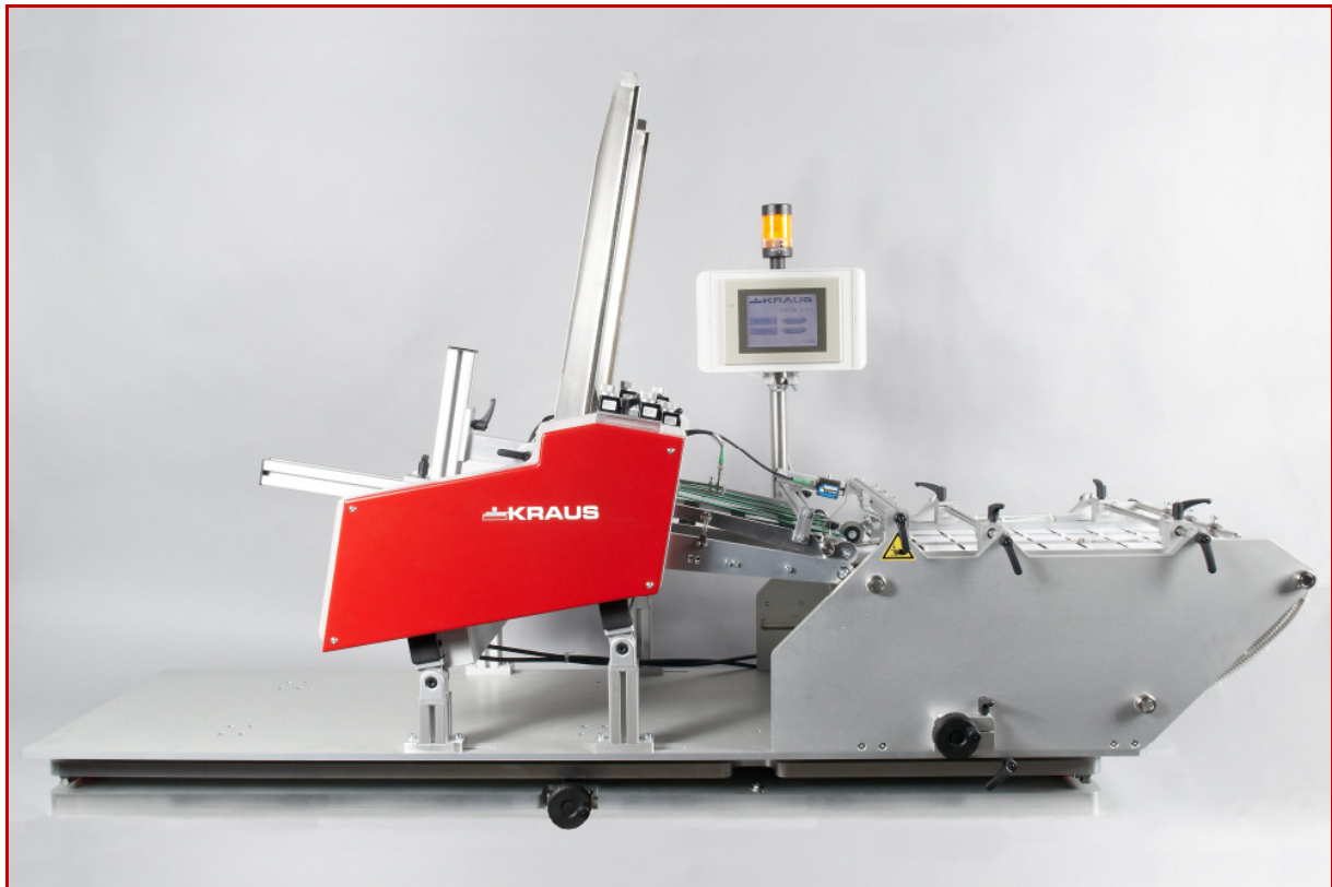
Bookletmodul mit Joker Servo mit vertikalem Magazinschacht

Durch die kurzen Rüstzeiten und den modularen Aufbau kann die Maschine wirtschaftlich auch für Jobs mit kleineren und mittleren Losgrößen eingesetzt werden. Durch die moderne Steuerungstechnik wird eine hohe Präzision auch bei hohen Leistungen erreicht und so können auch sehr enge Teilungsabstände gefahren werden. Mit der neuartigen Riemenspanntechnik können Riemenlängen von 1410 bis 1600 mm eingesetzt werden. Dementsprechend können auch die Teilungen auf die jeweiligen Booklets ausgewählt werden.